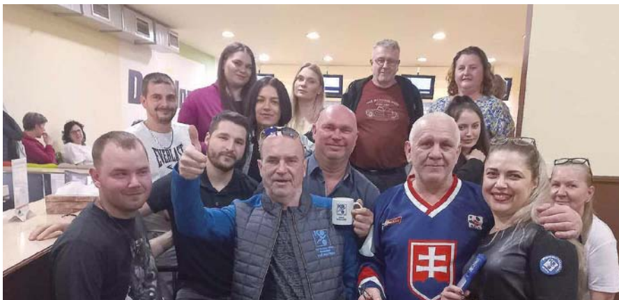
Doslova mezinárodní kovácké družstvo na bowlingu.

Pořádáte také nějakou volnočasovou aktivitu? Napište o ní, pošlete fotky, inspirujte ostatní kolegy a kolegyně, my ji rádi zveřejníme v Kovákově nebo na sociálních sítích KOVO.