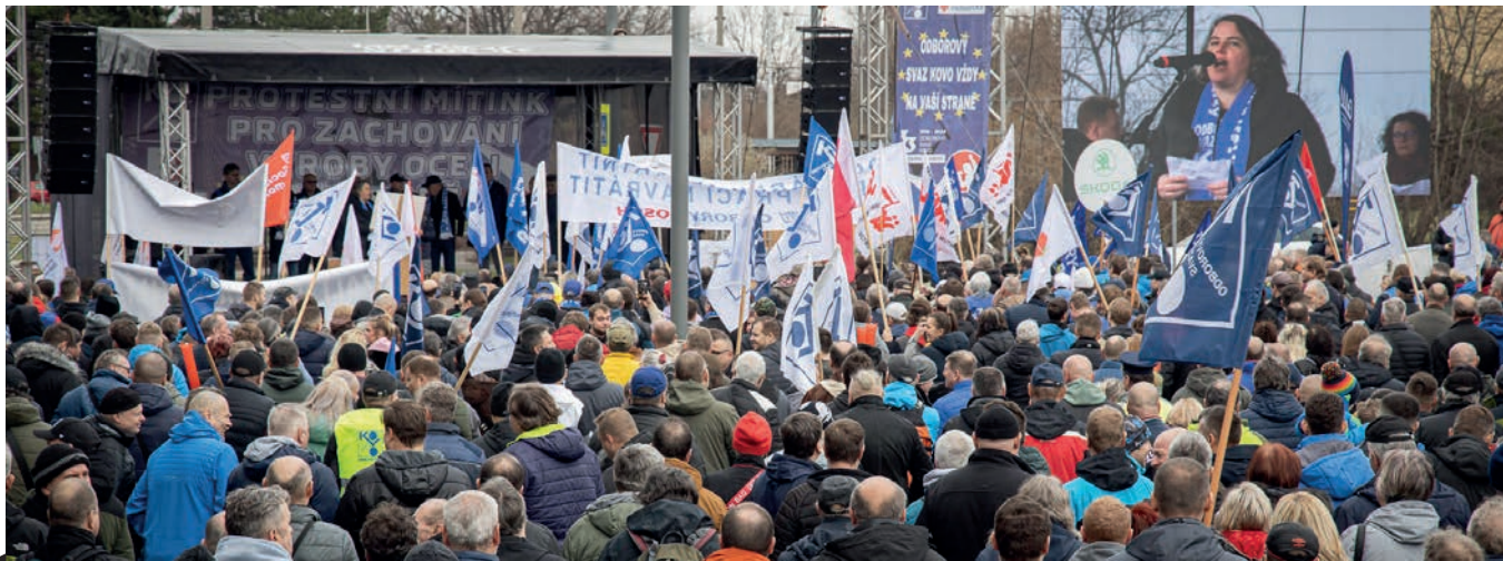
Zaměstnanci s odboráři zaplnili parkoviště na dohled hutě.