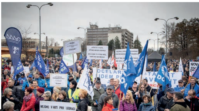
Po dobu protestního mítinku ovládla prostranství nedaleko bran hutě atmosféra plná obav, ale i odhodlání hájit pracovní místa a české ocelářství vůbec.