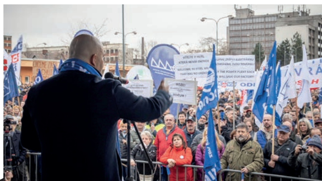
Pohled na protestující z pódia.