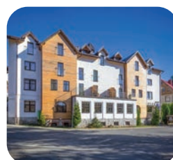
Boutique Eco Hotel Sasanka