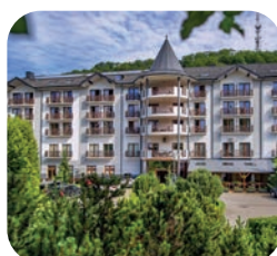
Hotel Verde Montana Wellness & Spa