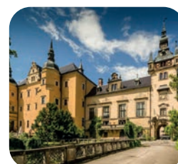
Hotel Zamek Kliczków

Nově na Spa.cz najdete celou řadu luxusních polských wellness hotelů, které se vyplatí navštívit. Jako členové OS KOVO máte automaticky slevu 5 % i na akční či zlevněné pobyty.