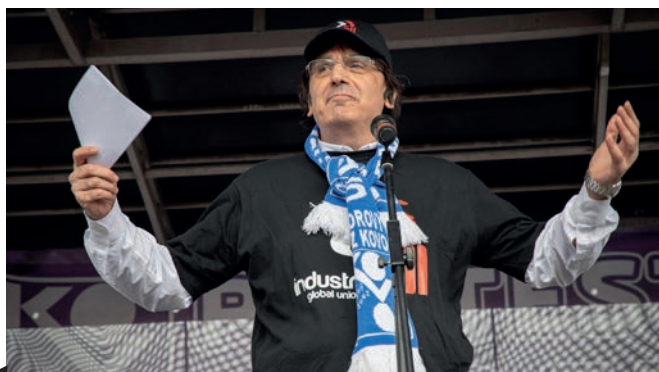
Jedním ze zahraničních řečníků byl Kemal Ozkan, zastupující generální tajemník IndustriALL Global Union.