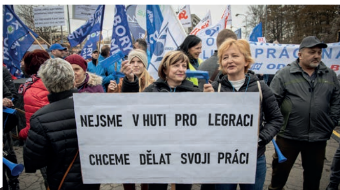
Jedno z hesel, které demonstranti skandovali.