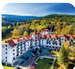
Hotel Buczyński Medical & Spa