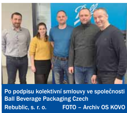
Po podpisu kolektivní smlouvy ve společnosti Ball Beverage Packaging Czech Republic, s. r. o.

Opět po roce si vám, milí čtenáři, dovoluji představit souhrn událostí a činností regionálního pracoviště v Plzni. Všichni jsme byli v tomto období ovlivněni probíhajícím válečným konfliktem na Ukrajině, rekordní inflací a vysokými cenami energií. Ovlivněni byli beze zbytku všichni obyvatelé České republiky, zaměstnanci, důchodci, OSVČ, ale i podnikatelé.