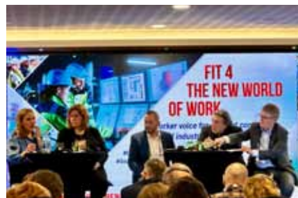
Při jedné z panelových debat.

Evropa aktuálně prochází náročným obdobím: v evropském průmyslu dochází k masivním změnám, opět se objevují hlasy volající po zavedení úsporných opatření a narůstá politická nejistota. Odbory jen čtyři měsíce před volbami do EU vyzývají všechny průmyslové pracovníky v celé Evropě, aby se postavili za svou práci a průmysl tím, že budou hlasovat pro kandidáty, kteří podporují dobrá průmyslová pracovní místa a demokracii v práci. Bez hlasu pracujících nebudou v Evropě žádná prosperující strategická odvětví s vysoce kvalitními mzdami a pracovními podmínkami! Nezbytným předpokladem pro zodpovědná strategická rozhodnutí, která respektují lidi a planetu v celém dodavatelském řetězci a zároveň utvářejí pevnou budoucnost pro společnost procházející masivními změnami je sociální dialog na všech úrovních (podnikové, odvětvové, národní, evropské). Je však nutné mít na paměti, že potřebujeme odvážná opatření v úrovni EU k zajištění pevného právního rámce s rozšířenými právy pro pracovníky a odbory.