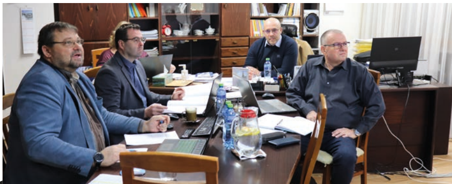
Výkonné vedení vedlo lednovou schůzi předsednictva z pracovního předsedy.

Závod v průmyslové zóně Triangle mezi Žatcem a Louny je první, který společnost zřídila mimo Asii, zaměstnává zhruba tisíc lidí. Kapacita podniku je až 11 milionů pneumatik ročně. Nástupní mzda operátora výroby činí 22 500 korun. Stávka v Nexenu bude v novodobé historii největším protestem zaměstnanců. (jom)