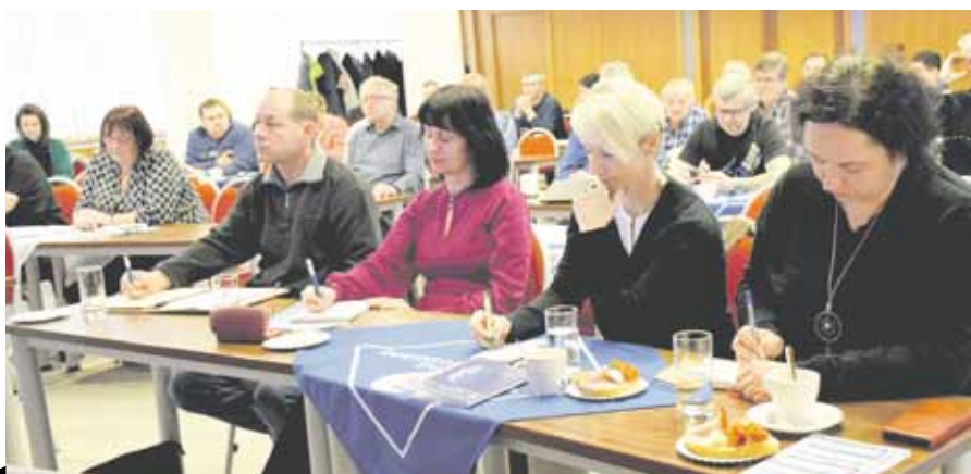
Jihočeští kováci jednali v českobudějovickém Metropolu.