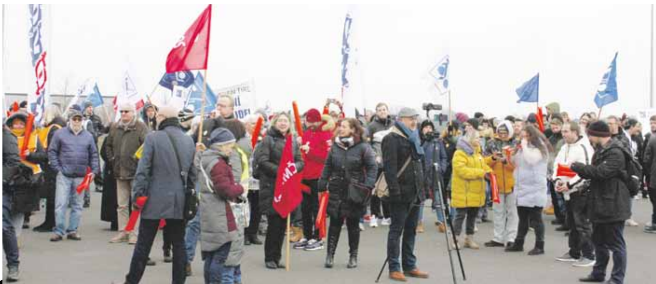
Na druhé demonstraci před společností Nexen Tire se začátkem minulého týdne sešlo přes dvě stě lidí.

Odboráři se také dočkali masivní podpory od svých kolegů nejen v České republice, ale i v zahraničí. Koncem minulého týdne se k nim přidala také evropská odborová centrála industriAll Europe. Ta na svém kongresu v Miláně dokonce přijala rezoluci, v níž postoj managementu odsoudila a vyzvala je k jednání s odbory. (jom)