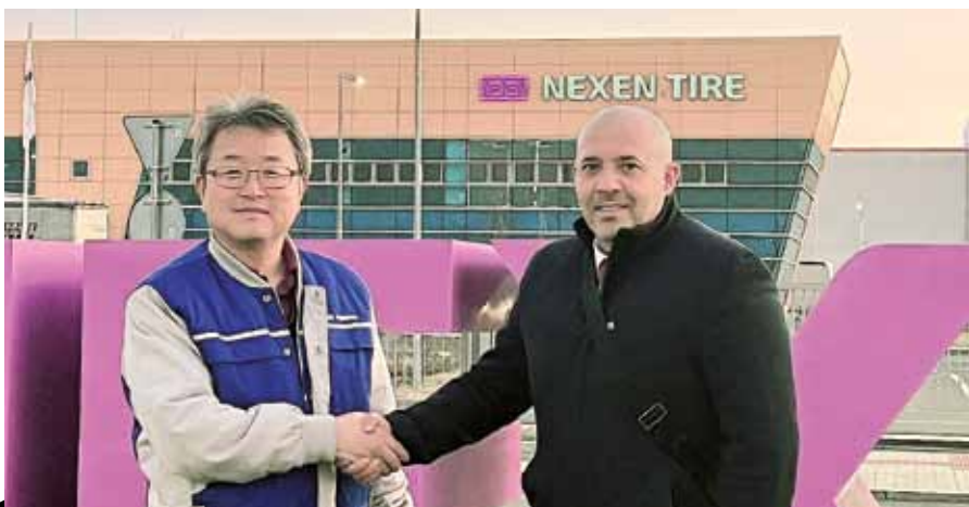
Předseda OS KOVO a korejský manažer společnosti Nexen Tire po podpisu dohody, jež ukončila stávku.

Přesně týden od zahájení skončila minulý týden v úterý 7. února stávka v korejské společnosti Nexen Tire v Bitovevsi na Žatecku. Odborům se podařilo prosadit významnou část požadavků. Je to výsledek mimořádně obtížných jednání mezi vedením Odborového svazu KOVO a zástupci korejského vlastníka. Ukončení stávky je v tuto chvíli pouze podmíněčné. Jestliže společnost dohodu nedodrží, zaměstnanci se vrátí ke stávce a jejich časově neomezený protest bude pokračovat.