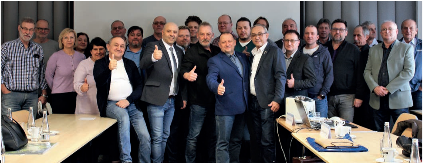
Společné foto po jednání valné hromady ve Vílanci na Jihlavsku.