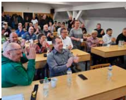
Konference RP Ostrava