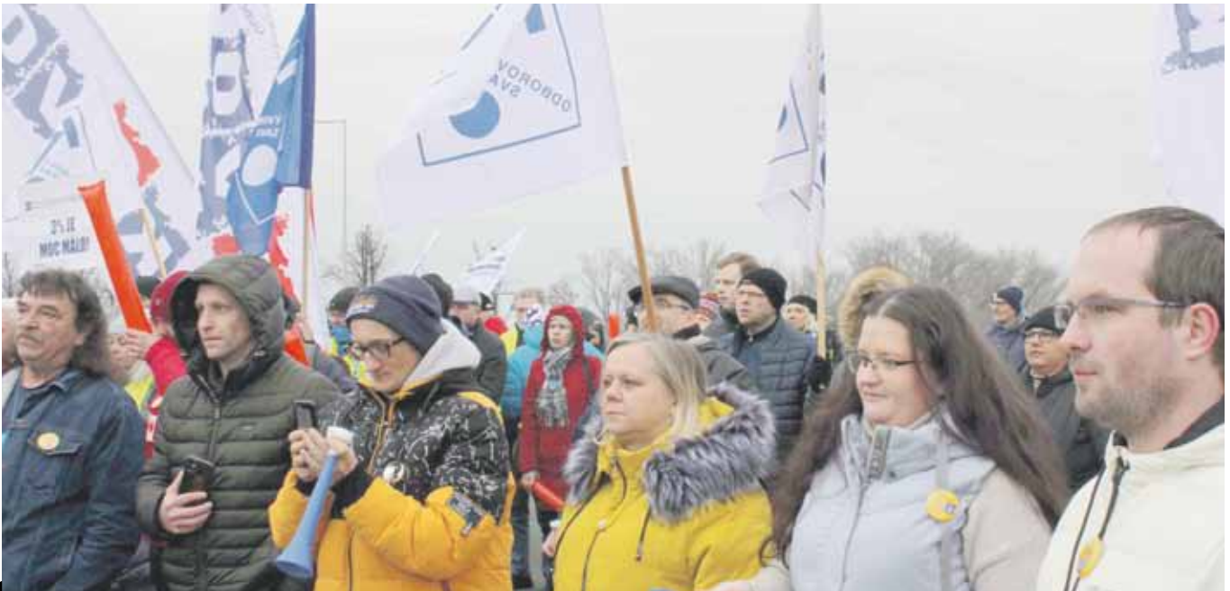
Protest v korejské automobilce přesvědčil řadu tamních zaměstnanců, že odbory jsou účinným nástrojem, v prosazování zájmů lidí.