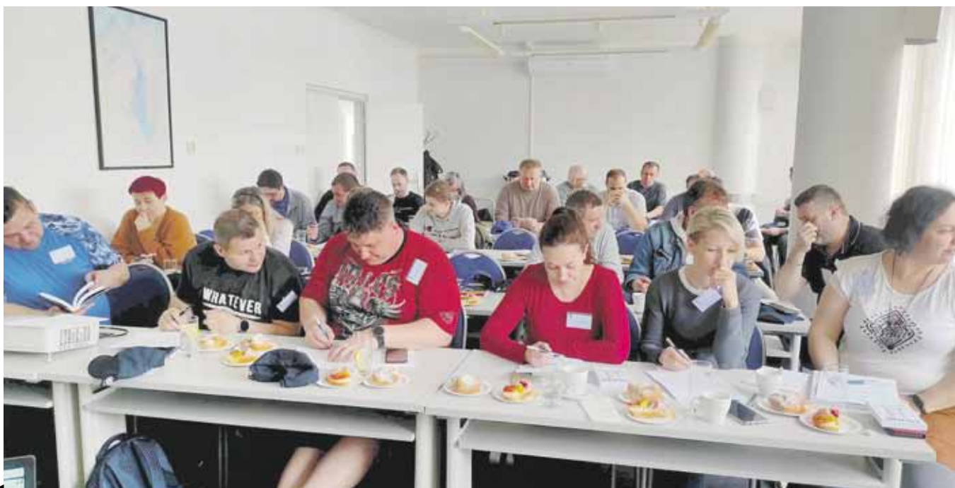
Motivačního školení se zúčastnilo zhruba 30 zástupců z jihočeských firem.