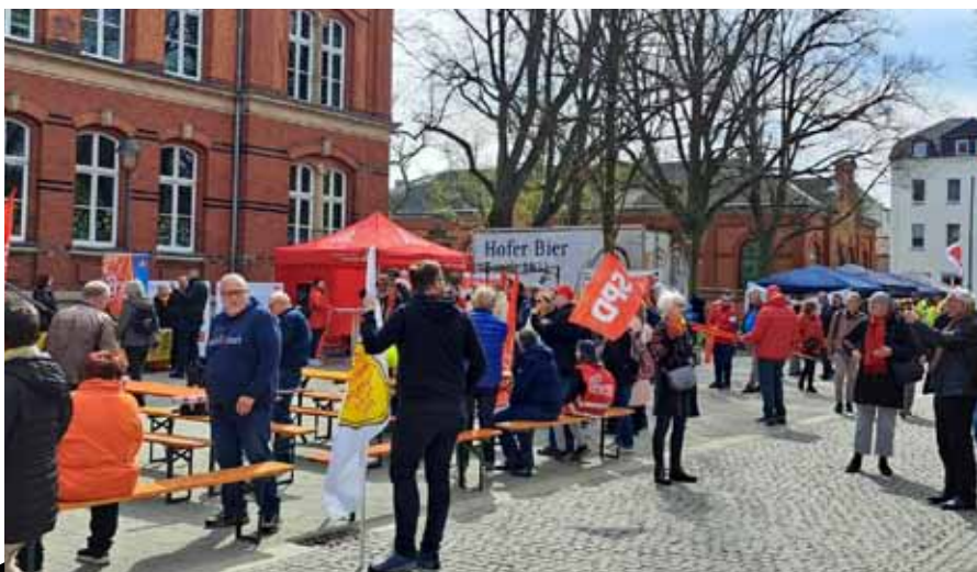
Oslav Svátku práce v Německu se účastnili zástupci OS KOVO.