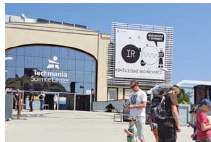
V neděli 28. května 2023 se v Techmania Science Center v Plzni uskutečnil dětský den plný zábavy pod záštitou ZO OS KOVO Škoda Power Doosan.

V neděli 28. května 2023 se v Techmania Science Center v Plzni uskutečnil dětský den plný zábavy pod záštitou ZO OS KOVO Škoda Power Doosan. Pro děti a jejich rodinné příslušníky, členy ZO OS KOVO a zaměstnance společnosti byly připraveny v rámci Techmanie všechny expozice, kde se mohli zájemci seznámit s informacemi o naší sluneční soustavě a celém vesmíru,