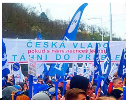
Krajská konference vyzvala vedení svazu k pořádání dalších protestů

Pokud ještě na závěr dodám, že v uplynulých měsících prošlo naše jihlavské regionální pracoviště komplexní stavební rekonstrukcí (náročnou po provozně organizační stránce pro zaměstnance i funkcionáře), může vám být jasné, že se letos na Vysočině opravdu nenuďme.