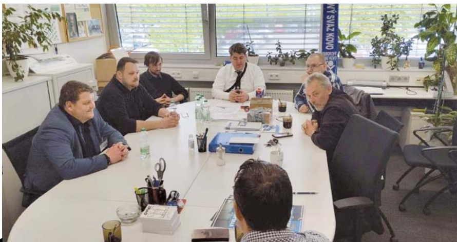
Setkání ve Vílanci u Jihlavy se zabývalo také tématem, jak omladit řady odborářů.