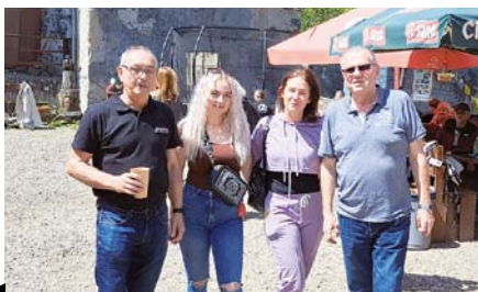
Dětský den Základní organizace OS KOVO WITTE Nejdek se odehrál na Horním Hradě Hauenštejn.

V sobotu 27. května 2023 uspořádala Základní organizace OS KOVO WITTE Nejdek ve spolupráci se zaměstnavatelem, společností WITTE Nejdek, dětský den, který se odehrál na Horním Hradě Hauenštejn. Akce pořádaná ve spolupráci zaměstnavatele a odborové organizace byla určena pro všechny zaměstnance společností WITTE. Bohatý program začal v 11,00 a pokračoval za krásného slunečného dne až do pozd-