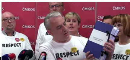
Josef Středula, předseda ČMKOS, se svazkem petičních archů.

Konference Krajského sdružení OS KOVO krajů Pardubice a Hradec Králové jednala v pondělí 3. dubna v Dašicích u Hradce Králové. Více než 60 účastníků z obou regionů hodnotilo činnost krajských sdružení, komentovalo také nedávnou demonstraci pořádanou svazem před Úřadem vlády ČR.