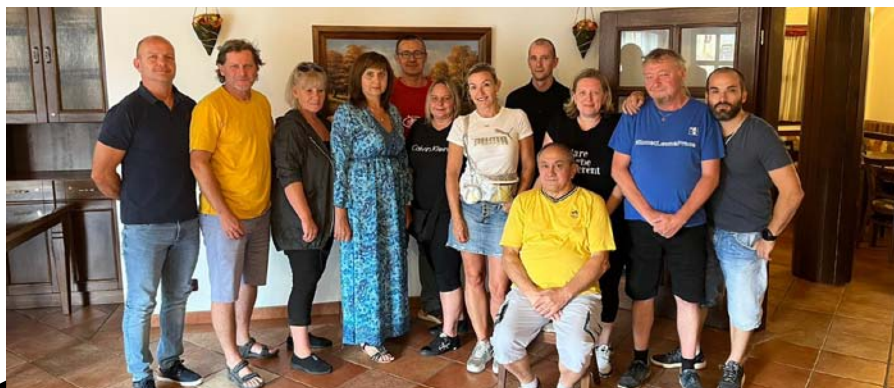
Výbor ZO HPR

Narovnání systému odměňování a sociálních podmínek všech zaměstnanců pěti tuzemských výrobních závodů francouzské společnosti Valeo je cílem nové společné kolektivní smlouvy. Až doposud probíhala kolektivní jednání v každém závodě samostatně. Už v září chtějí tamější vyjednávači OS KOVO společně předstoupit k úvodnímu kolu jednání s vedením firmy.