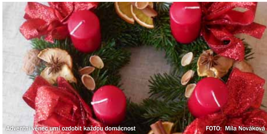
Adventní věnec umí ozdobit každou domácnost

Čtvrtá adventní neděle bude 24. prosince 2023. Je označována jako zlatá . Letos vychází zrovna na Štědrý den. Již by mělo být všechno připraveno, advent je u konce a zapálí se čtvrtá svíčka – Láska.