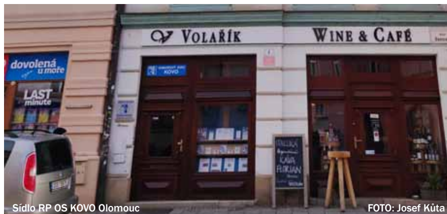
Sídlo RP OS KOVO Olomouc

Rada KS OS KOVO Olomouckého kraje pravidelně zasedá dle schváleného plánu v sídle RP Olomouc. A na konci listopadu nás čeká společné zasedání VO KS OS KOVO Olomouckého kraje, které probíhá již tradičně v penzionu Majorka ve Slatinicích.