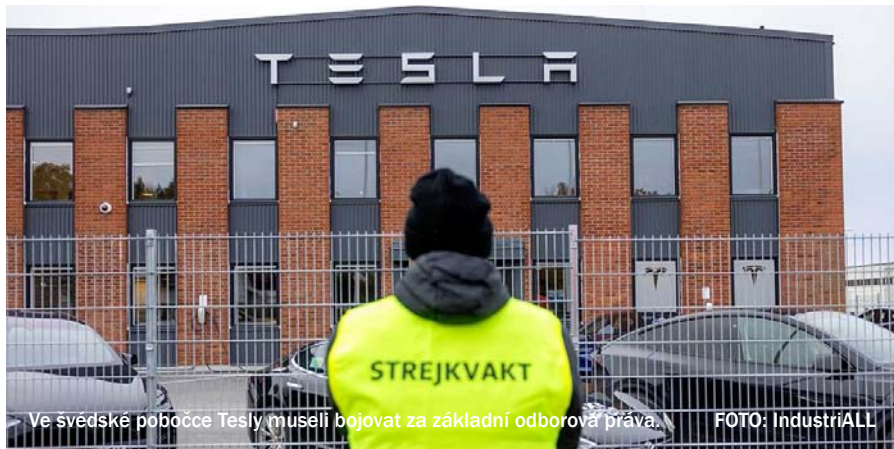
Ve švédské pobočce Tesly museli bojovat za základní odborová práva.

Index globálních práv ITUC (Světové odborové konfederace) pro rok 2024 vysílá jasný a naléhavý signál, že demokratické hodnoty a základní práva, na kterých se většina zemí dohodla na mezinárodní úrovni, se hroutí.