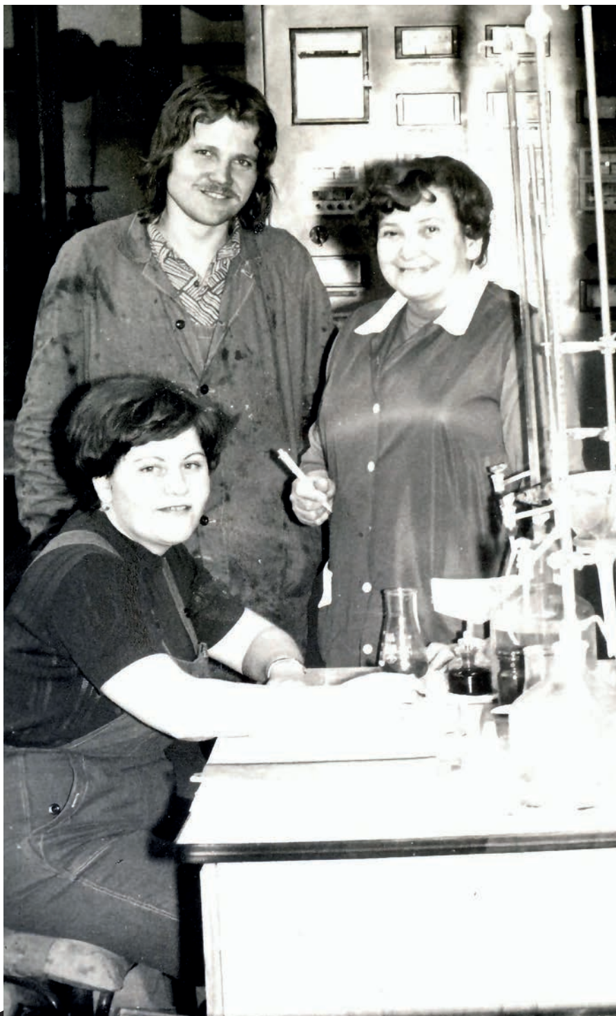
Budoucí ministr ještě v montérkách.