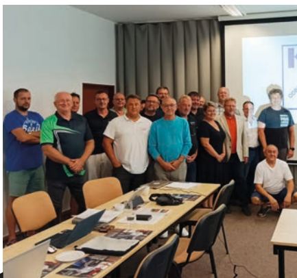
Společné foto účastníků jednání autosekce OS KOVO

V rámci kolektivního vyjednávání se zástupci OS KOVO dohodli s vedením Vítkovice STEEL, a.s., na vyplacení jednorázové odměny pro zaměstnance firmy až do výše 10 000 korun v závislosti na délce pracovního poměru. Ta bude vyplacena v rámci říjnové výplaty. „Jsem rád, že si vedení firmy uvědomuje, jak klíčové je udržet ve firmě stabilní kvalitní tým schopný reagovat na potřeby zákazníků. Vyjednávání pokračuje a OS KOVO se snaží zajistit pro zaměstnance co nejlepší podmínky pro příští rok,“ uvedl předseda našeho svazu Roman Ďurčo , který v tomto podniku pracoval od roku 1995 a je ve vyjednávacím týmu. (ex)